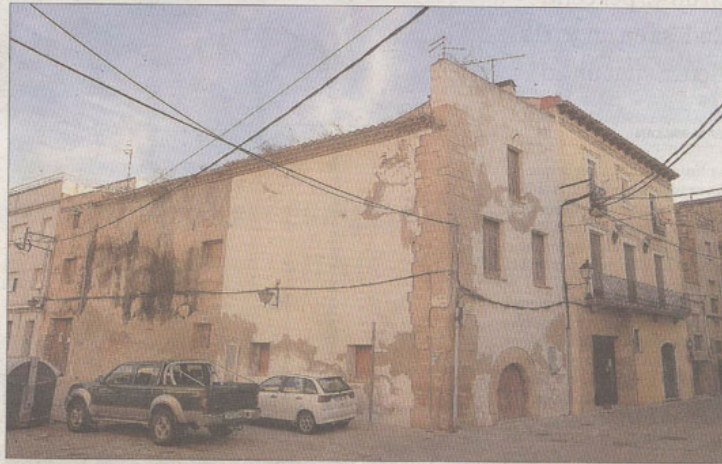
Imatge del grup d'edificis que formaran part de la futura residència universitària, ahir.

Gràcies a un conveni subscrit abans d'ahir entre l'Ajuntament de Tortosa, la Generalitat i el Ministeri de Foment, la construcció de 18 de les 50 places d'allotjaments previstes rebran ajuts estatals, concretament 71.922 euros. Aquests 18 allotjaments eren els únics que podrien rebre ajuda pública mitjançant aquest conveni. L'Ajuntament de Tortosa, per la seva banda, posarà a disposició del projecte l'edifici de la sinagoga però no hi aportarà di-