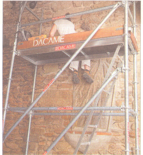
S'ha instal·lat una bastida al Portal del Romeu per tal de poder dur a terme la restauració dels elements.

A més del seu valor patrimonial, el Portal també és important des del punt de vista turístic, ja que esdevé l'inici de l'itinerari senyalitzat com a Camí de Sant Jaume de l'Ebre. Per aquest motiu, aquesta acció s'emmarca dins del Pla de Foment Turístic.