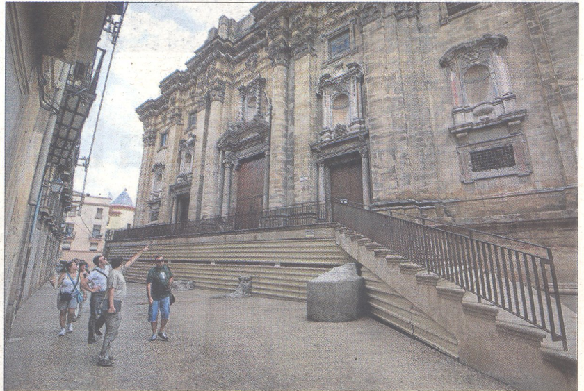
Turistes observant l’exterior de la catedral de Tortosa.