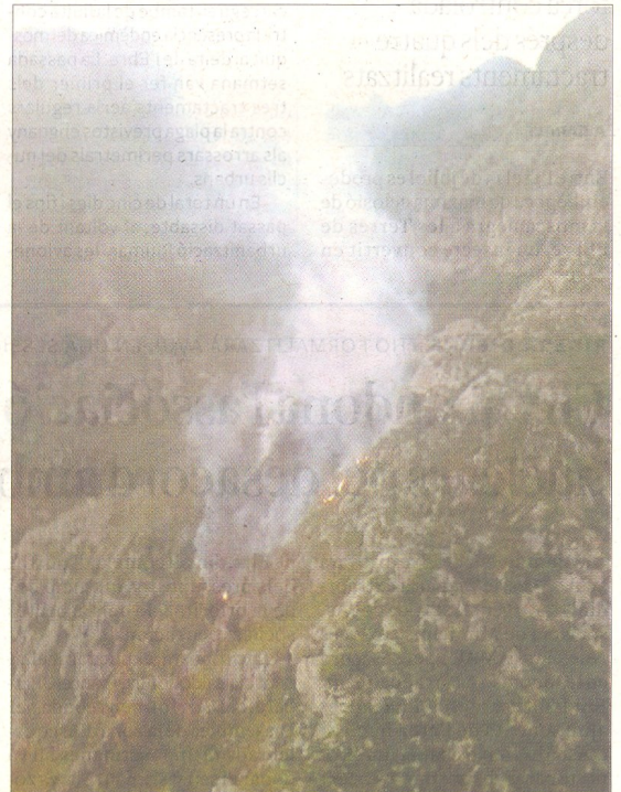
L'incendi de la serra de Cardó, al terme de Tivenys, en una zona de difícil accés.

■ Avui fa només dues setmanes, els Bombers de la Generalitat aconseguen controlar el primer gran incendi de les temporades a Catalunya, al mateix municipi de Tivissa. Durant quatre dies, desenes d'unitats terrestres i aèries, amb l'ajut fins i tot d'unitats cedides per l'Estat, van combatre un foc forestal a l'espai natural de les Muntanyes de Tivissa-Vandellòs. Les flames van calcinar, finalment, 830 hectàrees de pi blanc i matoll en una zona de molt difícil d'accés per l'absència de pistes forestals o camins. Una tempesta d'aigua va facilitar l'extinció de les flames, que no van provocar danys personals. L'incendi, tanmateix, obligà a desallotjar de manera temporal mig centenar de veïns d'habitacles disseminats. -A. CARALT