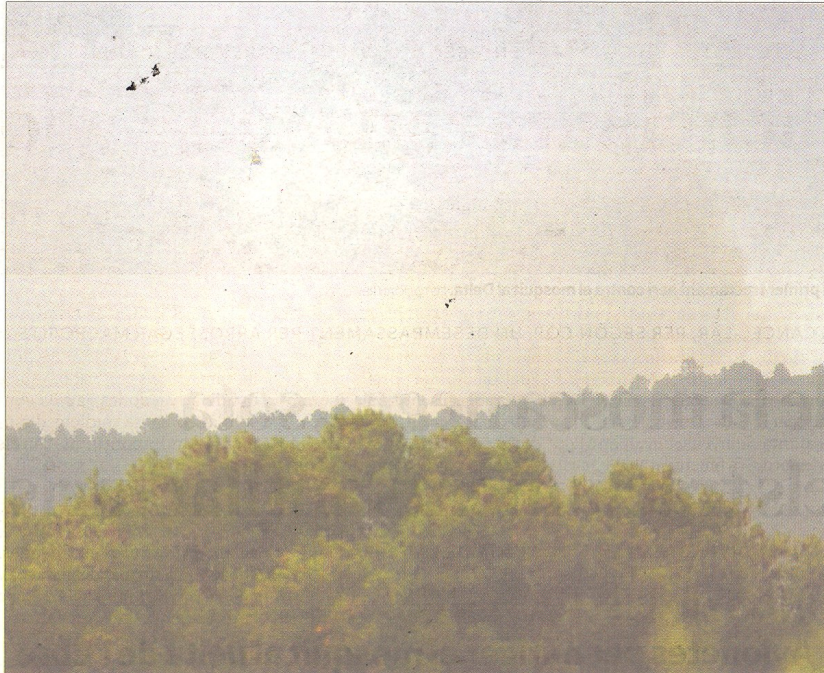
Un helicòpter treballant en el nou incendi de Tivissa.

L'incendi va quedar extingit durant la mateixa tarda i final-