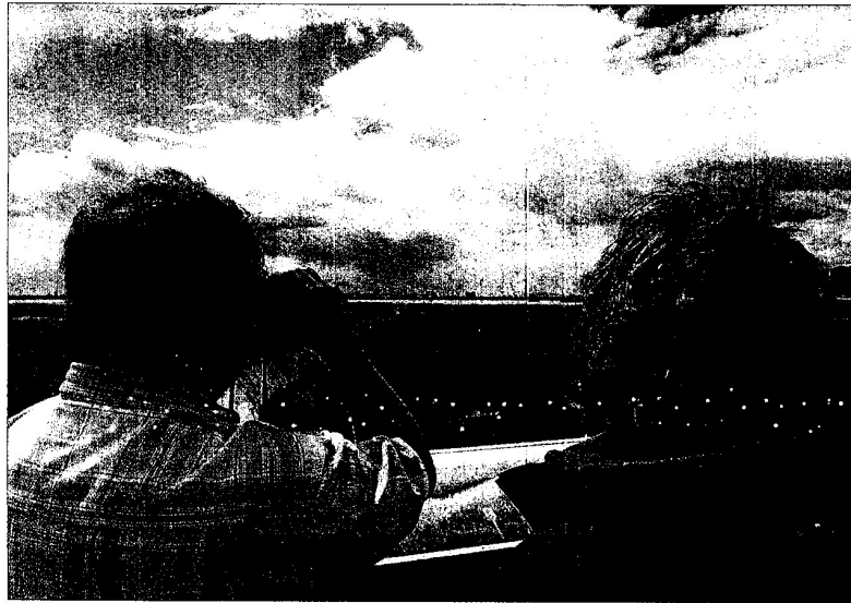
Dos turistes observen ocells al Parc Natural del Delta de l'Ebre.

L'esdeveniment inclourà conferències d'experts, cursos, tallers i concursos, així com una fira de productes i serveis per als