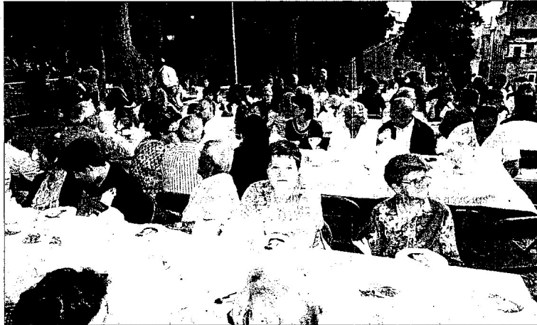
Imatge d'un dels actes de celebració que va fer l'Associació per celebrar el quart de segle de vida.

Cardona fa un bon balanç a l'hora de valorar el quart de segle de l'associació: «s'ha millorat molt el barri. Quan vam començar, ho vam fer per fer activitats; després vam passar uns anys dolents amb alguns problemes derivats de la immigració, però des de fa dos o tres anys, tot està bé. Podem dir que és el barri més tranquil de Tortosa.