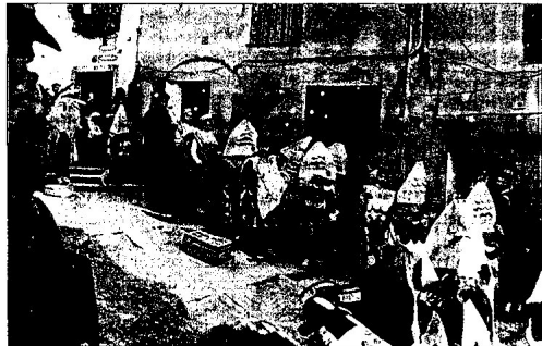
Imatge d'alguns dels participants en el carnaval celebrat per l'Associació de Veïns Montcada - Santa Clara.

També s'ha de subratllar que les autoritats ens han ajudat molt, cosa importantíssima».