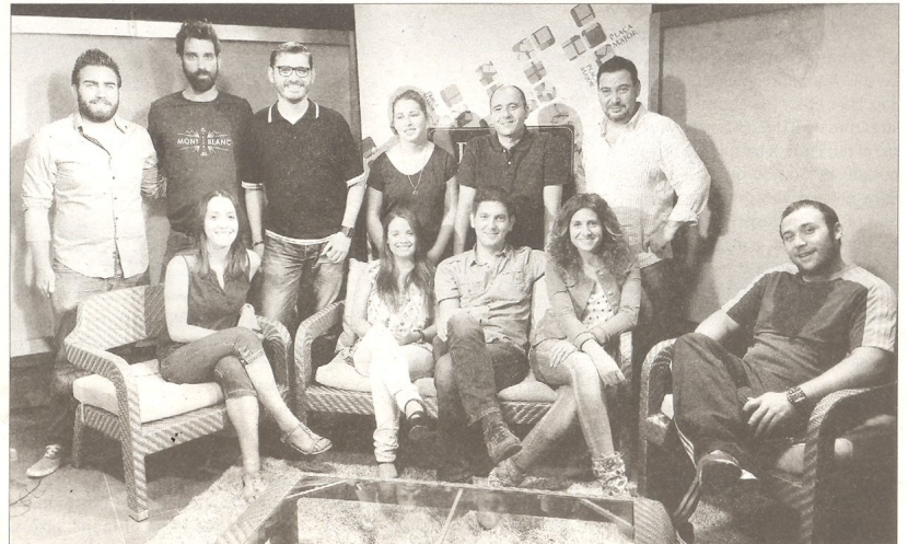
A la imatge, el personal del Canal Terres de l'Ebre en una imatge de grup presa al plató.

se al projecte d'una televisió única per al territori, Canal 21, dels 13.000 espectadors que li acreditava el Baròmetre (ja desaparegut) fa més d'un any passa a un 'share' 0 en rècord d'un dia, i a només un 3% en rècord mensual, que equival a 6.000 espectadors actuals. La xifra situa aquesta marca -la més antiga del territori- més enllà del lloc 25 del rànquing de totes