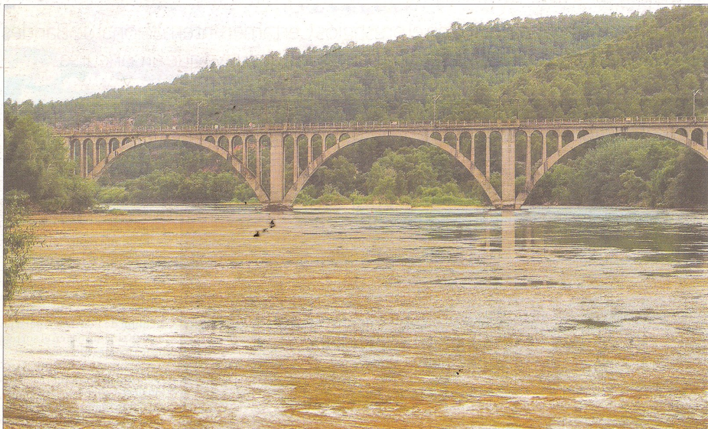
El baix cabal de l'Ebre, al seu pas per Garcia, ha permès aflorar un gran banc d'algues situat a la zona del pas de barca.

AIGUA ■ AHIR EL CABAL DEL RIU AL SEU PAS PER TORTOSA ERA QUATRE VEGADES MENOR QUE EL DIA 1 DE MAIG