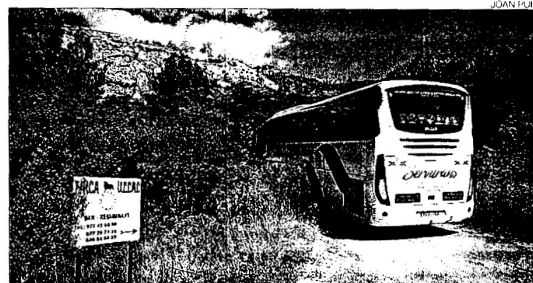
►► Per camins ► Un autocar porta turistes a una corrida, el 2012.

Les despeses de manteniment són massa altes per prosperar. I a més, tan sols mostren la seva activitat tradicional, no hi ha maltractament a l'animal, ni pagament d'entrada, perquè els turistes el que paguen és l'àpat als seus restaurants. «És com anar a una casa de pagès, pagar l'allotjament i veure les gran-