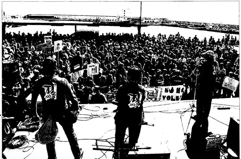
Milers de persones es van manifestar l'octubre passat al port de les Cases d'Alcanar

De moment només s'ha injectat un 17% del gas matalàs al subsòl, concretament 79 milions de metres cúbics. A més del gas matalàs, la capacitat del Castor és de 1.300 milions de metres cúbics, mentre que la capacitat de producció de la planta s'estima en 25 milions de metres cúbics diaris. ■