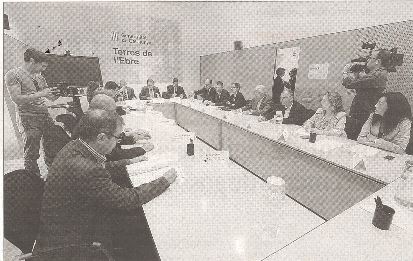
Reunió entre alcaldes i representants de la Generalitat, ahir a Tortosa.

«Sabem que hi ha nous estudis i alguns ja han d'estar en mans