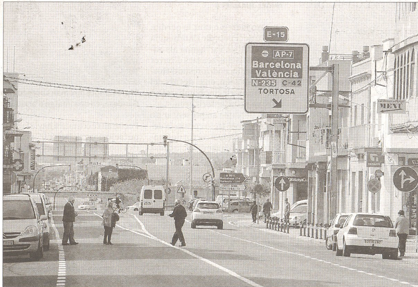
Un retrobament al mig de la carretera era fa cinc mesos una opció impossible, ahir.

Mentre els diners no arriben, el consistori és conscient que no pot demorar de manera indefinida les necessàries millores a la travessera per adaptar-la al seu nou caràcter de via urbana. Així, s'ha compromès a adequar aquest 2014 cinc nous passos de vianants