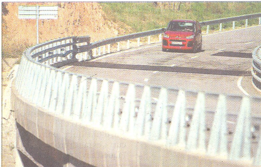
Les màquines han asfaltat més d'una desena de trams on havien aparegut fissures i moviments del ferm, ahir.