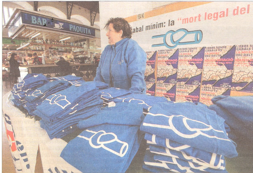
La parada de la PDE al mercat municipal de Tortosa posa a la venda samarretes.

Tomàs recorda que les mobilitzacions de la PDE sempre han obtingut un fort suport polític i social però remarca que aquest cop «el suport s'ha fet més explícit. És com si es volgués demostrar un suport a la plataforma i a la gent de l'Ebre. Si el temps acompanya, serà una manifestació impactant», tanca.