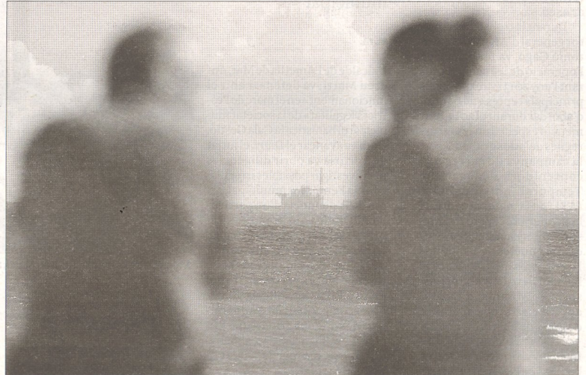
Dos veïns al passeig de les Cases d'Alcanar, amb la plataforma marina del Castor al fons.

Al capdavant de l'oposició ciutadana al Castor es manté la Plataforma en Defensa de les Terres del Sènia, que continua treballant per aconseguir l'abandó definitiu del projecte i per denunciar «les irregularitats» del