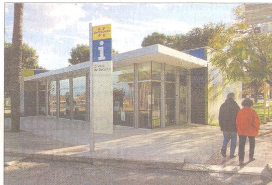
Nova oficina de turisme de Sant Carles de la Ràpita, ubicada al parc de Garbí, a tocar del port.

Pel que fa a Ports de la Generalitat, preveu inversions per adaptar el port rapitenc a l'arribada de passatgers i fer millores en equipaments, senyalització i mesures de seguretat.