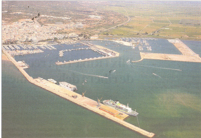
Imatge aèria del port de Sant Carles de la Ràpita, a la badia dels Alfacs.

De forma paral·lela a aquesta promoció, Sant Carles de la Ràpita es prepara ja per rebre els primers creueristes. La primera escala tindrà lloc el 9 de juliol, en