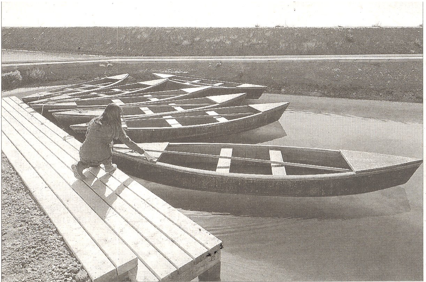
MónNatura ha habilitat un nou embarcador al recinte per facilitar la navegació amb pontones.

REPORTATGE | L'any 2013 més de 15.000 persones van visitar el complex