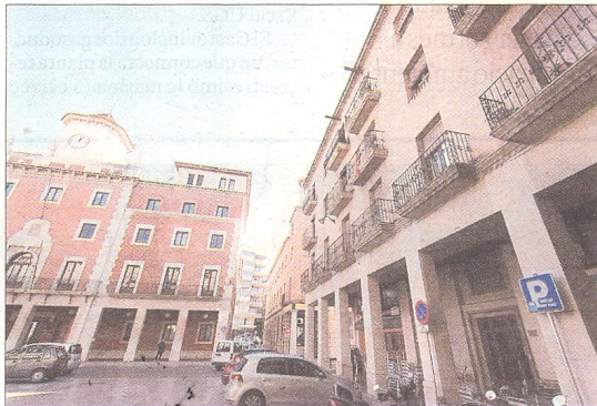
La urbanització de la plaça d'Espanya amb el nou Ajuntament fou una de les obres més importants de la reconstrucció de la ciutat.