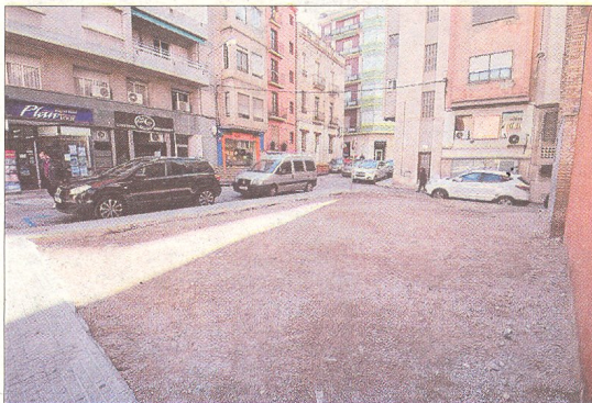
Solar buit al carrer Ricard Cirera del centre urbà de Tortosa, on hi havia prevista una actuació de Regiones Devastadas.

L'aviació franquista va bombardejar de manera sistemàtica la ciutat ebrenc a l'any 1938