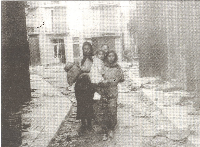
Tres dones i una xiqueta, de retorn a Tortosa, al carrer d'en Carbó.

La capital s'emportà més de la meitat del pressupost destinat a les deu poblacions ebrencques.