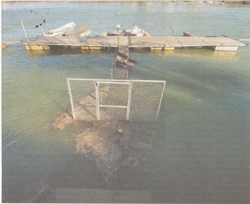
Embarcador del Nàutic de Móra d'Ebre, inundat.

El president de la CHE, Xavier de Pedro, en canvi, assegura que aquest pla hidrològic de la conca de l'Ebre és la garantia que no hi ha haurà un nou projecte de transvasament de l'Ebre. Tot i admetre que és «una preocupació», assegurà que des del punt de vista del disseny del pla hidrològic «no hauria de ser possible». «Hem de defensar els recur-