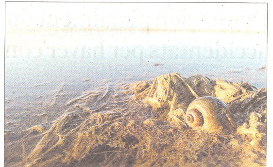
Un camp d'arròs completament inundat amb aigua salada, ahir a la tarda al marge esquerre del Delta.

necessitat d'actuar en fermesa, després que alguns arrossaires han perdut enguany fins el 70 per cent de la producció a causa de la plaga.