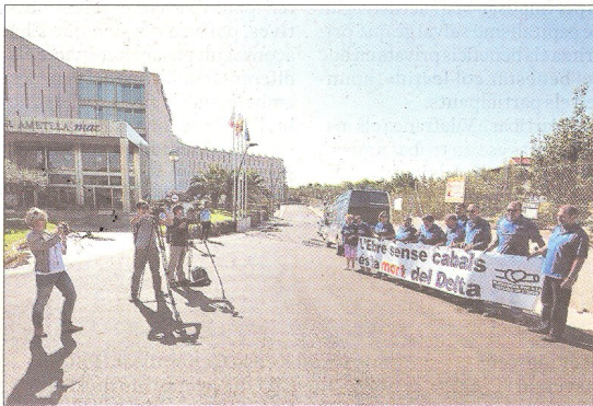
Onze activistes de la Plataforma en Defensa de l'Ebre van rebre ahir Cañete amb crits de 'Lo riu és vida. No al transvasament!'.

trobada de projectar un transvasament de l'Ebre en el futur Pla Hidrològic Nacional.