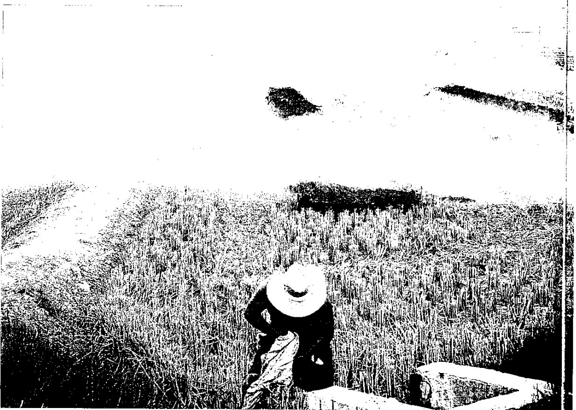
Foc contra la plaga: un pagès fent ahir una crema controlada al seu arrossar, ja segat, amb l'objectiu d'eliminar cargols

La UE ha denegat a més el projecte Live sol·licitat per la Generalitat aquest 2013 per dur a terme els propers tres anys una actuació de gran abast amb l'objectiu a més d'investigar com es pot eradicar una espècie invasora que mai abans no s'havia establert a Europa. El projecte, amb una inversió prevista de 4 milions d'euros, haurà d'esperar. La Generalitat, que pensa tornar a sol·licitar l'any que ve l'ajuda a Brussel·les, també espera que s'impliqui d'una vegada el Govern central. "La plaga es podria expandir per tota la Península i per Europa", adverteix Jordi Sala, director general de Desenvolupament Rural del Departament d'Agricultura. Davant aquest panorama, ara