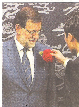
Rajoy recibió una rosa a su llegada al encuentro Japón-España.

■ Rajoy está crecido en su viaje a Japón. Presumió durante un desayuno con una destacada delegación de empresarios japoneses, que representaban el 50% del PIB del país, de su acierto a la hora de aplicar sus ajustes y reformas porque se había demostrado que «tenía razón». «Estamos absolutamente convencidos de que debemos dejar atrás la percepción sombría que se tenía sobre nuestra economía. Hace un año se hablaba de cuándo iba a ser rescatada España. Hoy eso es historia y se habla de cuán grande va a ser la recuperación de la economía. Los resultados permiten ser algo más optimistas que hace unos meses y confirman que la opción elegida por mi Gobierno era la correcta. Y que empieza a dar frutos. Eso se ve en los análisis de los expertos internacionales y en la prima de riesgo», manifestó durante su intervención en Tokio en el encuen-