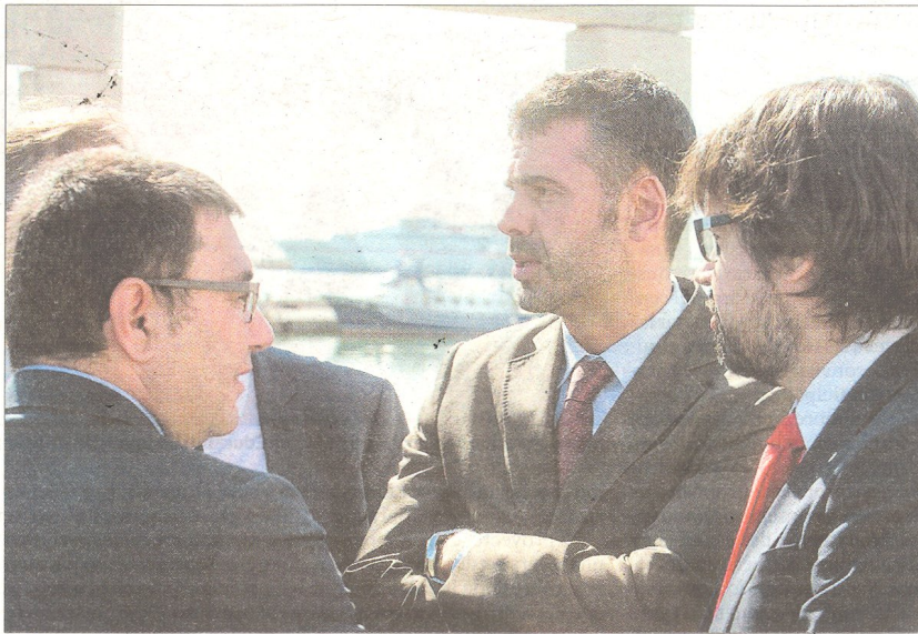
El conseller Sant Vila va visitar ahir el port de Sant Carles de la Ràpita.

A banda d'anunciar l'arribada dels primers passatgers l'estiu de 2014, Vila va signar un conveni amb l'ajuntament rapitenc i la Cambra de Comerç per impulsar la destinació sobre la marca 'Delta Ebre Port' i promoure-la en