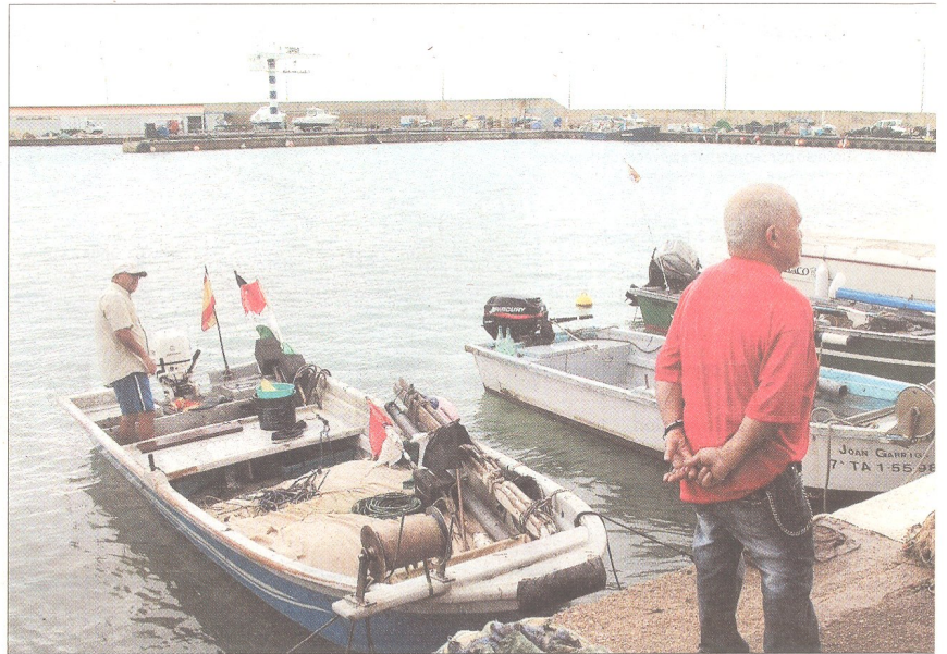
Pescadores de las Casas de Alcanar conversan sobre los terremotos de la madrugada del jueves.

■ Aléjese. Evite las zonas costeras, ya que puede haber peligro de grandes olas y tsunamis.