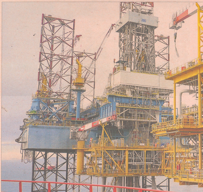
Plataforma des d'on es controla l'operació d'injecció de gas