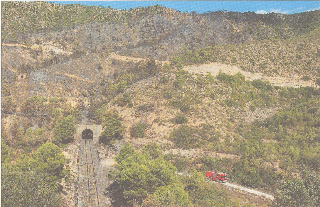
Un tram descobert entre dos túnels al barranc de Barvall, a Ribera-roja d'Ebre, fou l'origen de l'incendi a l'Espai natural, ahir a la tarda.