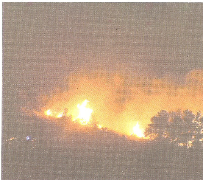
El foc va continuar cremant durant la nit, i també la feina dels bombers i ADF.

molt frondosa i de difícil accés, podria suposar una expansió encara molt més gran de l'incendi.