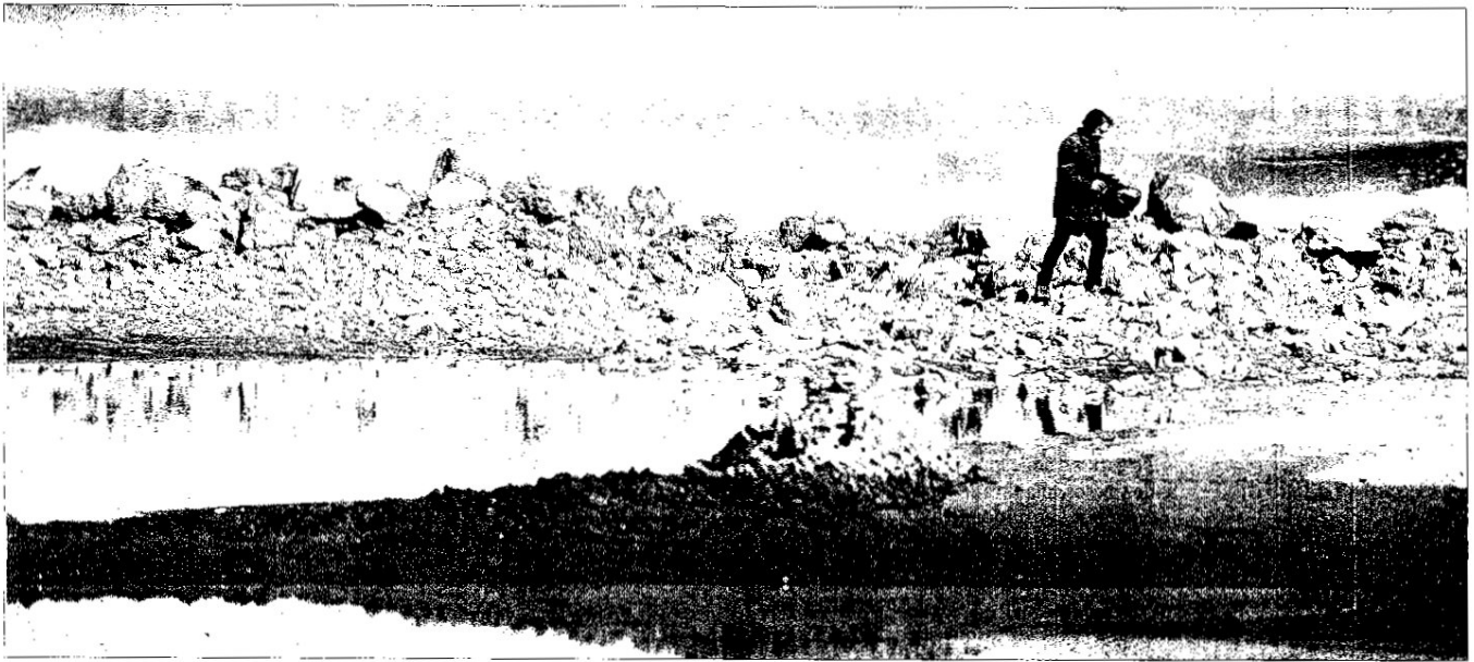
Un home observa els efectes del mar a la zona d'accés a la punta del Fangar i la platja de la Marquesa.

BAIX EBRE I MONTSIÀ ■ ENCARA CUEJAVEN AHIR ELS EFECTES DEL TEMPORAL