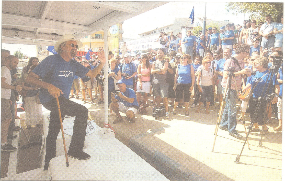
Els Quicos van rememorar les cançons de la lluita antitransvasista d'una dècada enrere a bord del catamarà solar.

Dos pilars del a colla castellera dels Xiquelots del Delta els van donar la benvinguda mentre que els Quicos rememoraven amb les