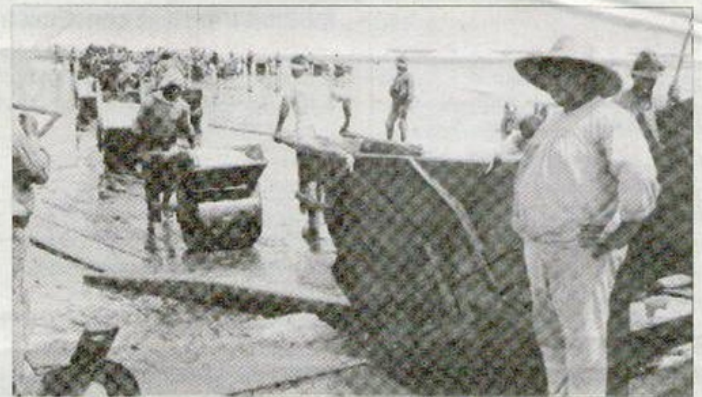
Treballs de recollida de sal immortalitzats per Hitz.

El fons està integrat per 162 fotografies, guardades en tres àlbums. Una selecció d'una quarantena s'exposen des d'aquest divendres 25 de maig i fins a l'1 de juliol a la sala d'exposicions de l'arxiu, als Reials Col·legis. A la inauguració, el centre espera l'assistència de descendents de Hitz, que han pogut trobar com a resultat del procés de recerca establert per esbrinar més detalls de la figura d'aquest enginyer. Precisament, aquest contacte ha permès que l'exposició es complemente amb diversos objectes pertanyents a Hitz, com ara la càmera de fotos que va utilitzar o un aparell de mesura del terreny, que han sigut cedits temporalment per la família. ■