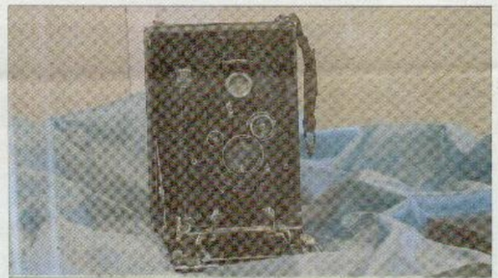
Hitz va fer les fotografies amb aquesta càmera, cedida pels seus descendents.