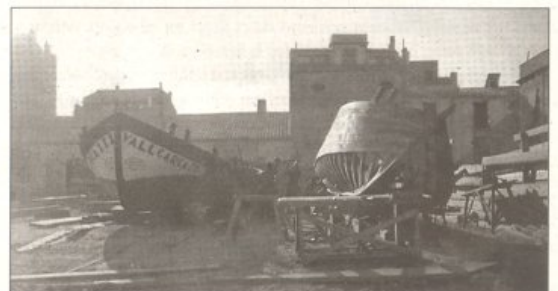
Dos llauts en construcció al barri de la Casota.