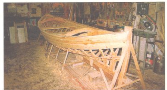
La muleta 'Dànae' en la fase d'enllestir la boca, o sigui en el moment d'haver subjectat les quadernes, bancs i cobertes i els elements que conformen l'obra morta.

Amb el Suport de: Campus de Cultura Popular Departament de Cultura de la Generalitat de Catalunya Ajuntament d'Ampostes, El Poble Nou del Delta Universitat Rovira i Virgili / Campus Terres de l'Ebre Centre d'interpretació de la Jota de les Terres de l'Ebre