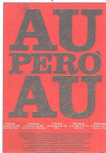
'AU PERÒ AU'