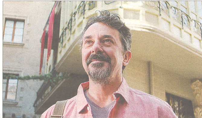
L'anunci de promoció de Tortosa, present al Festival Curt-Redó de Campredó.

Així, dijous, dia 27 de juny, ja s'hi van poder veure els documentals El pas de l'Ebre a Campredó , Natàlia a l'escola o Badia endins , i també el curt