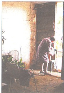
'L'ESTRATÈGIA DE MADAME BRETÓ'

De la realitzadora d'origen planer Zoraida Roselló. Curtmetratge documental que retrata la quotidianitat de la vida rural a la comarca del Montsià.