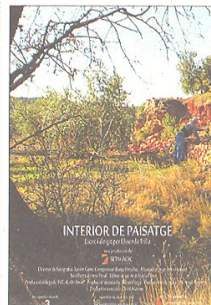
'INTERIOR DE PAISATGE'

Del fotògraf i realitzador tortosí Guillermo Barberà. Còmedia rodada al Delta que porta els tòpics de la nostra terra fins a l'extrem per riure-nos-en.