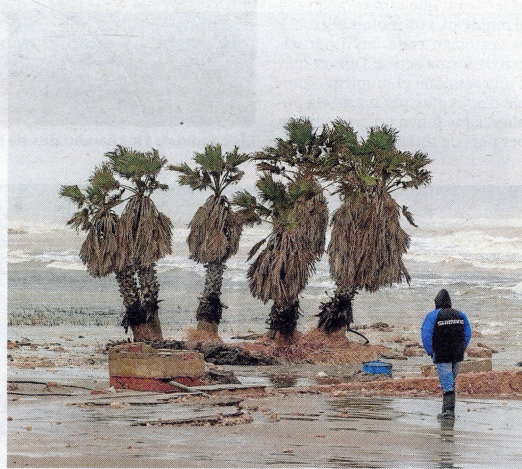
La zona de la bassa de l'Arena, a Deltebre, durant el temporal Glòria.

La Taula de Consens pel Delta, que reuneix municipis, comunitats de regants i altres entitats de la zona, va presentar un Pla Delta, amb les seves propostes per mantenir un territori en el qual volen