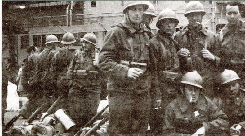
Legionaris de la 13 DBLE a Narvik.