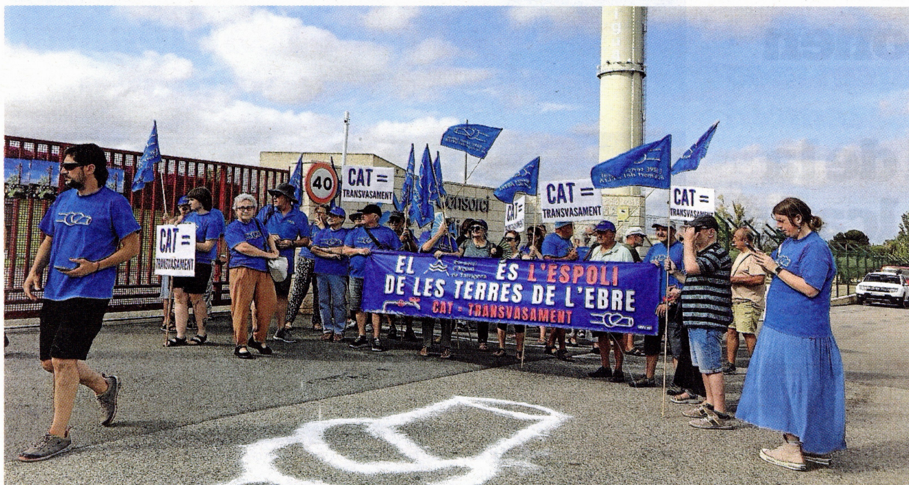
Membres de la PDE protestant a les portes del CAT a l'Ampolla, ahir a la tarda.