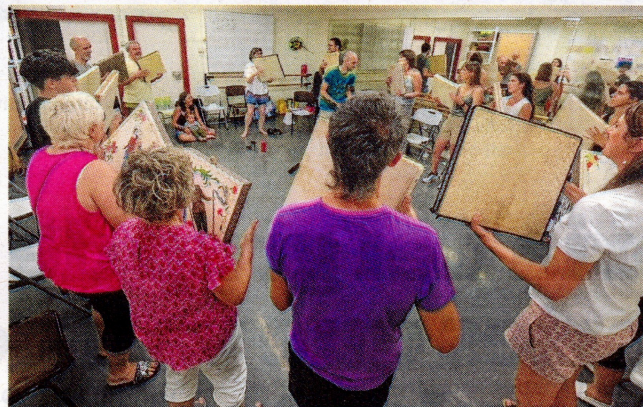
Els tallers són impartits per una quinzena d'especialistes en el camp de l'etnografia i l'etnomusicologia.

El punt final de la vetlada va arribar amb la part segona o final, l'esperat «picadillo» o «baralla de galls i gallines» entre dos bàndols