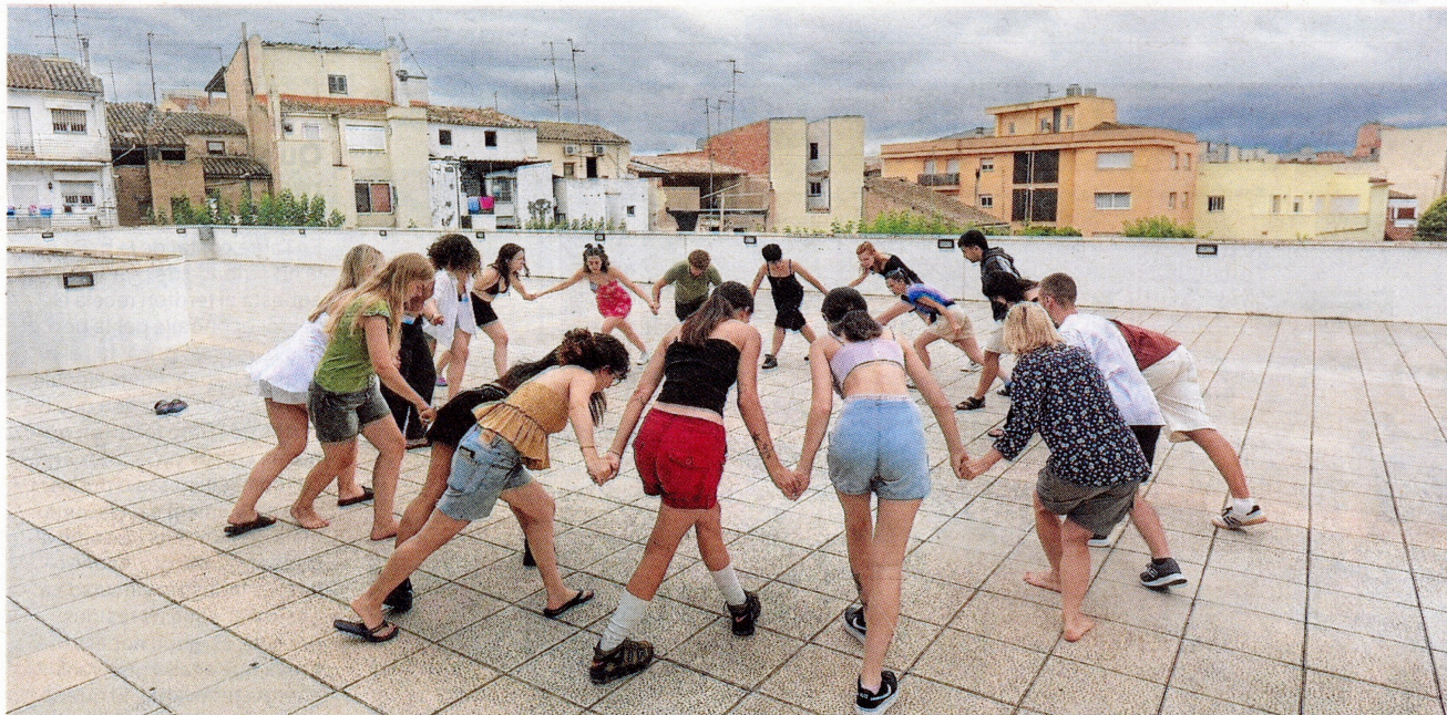
El campus inclou tallers formatius de ball, instruments, cant i poesia improvisada. A la imatge, tallers d'ahir al matí.