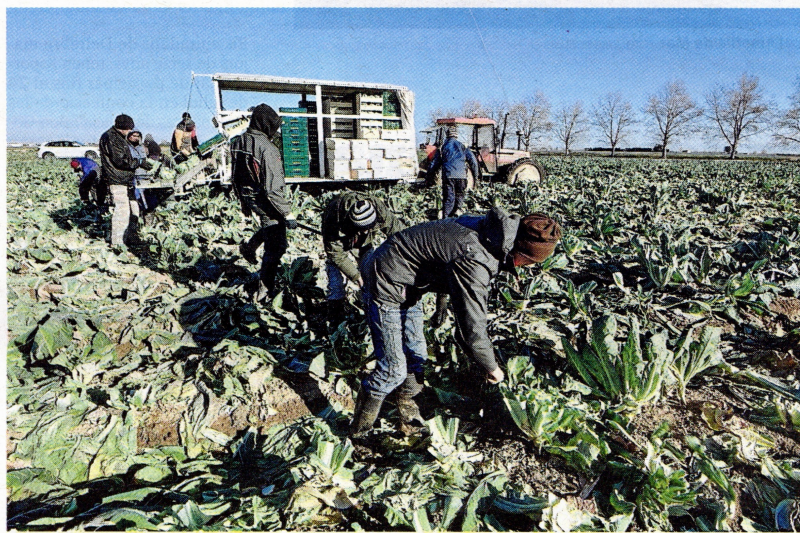
Treballadors del sector agrícola recollint verdura.

Tenint en compte aquestes variables, la comarca ebrenc a un nivell més baix és el Montsià. Segons explica al Diari el director de la Càtedra d'Economia Local i Regional de les Terres de l'Ebre,