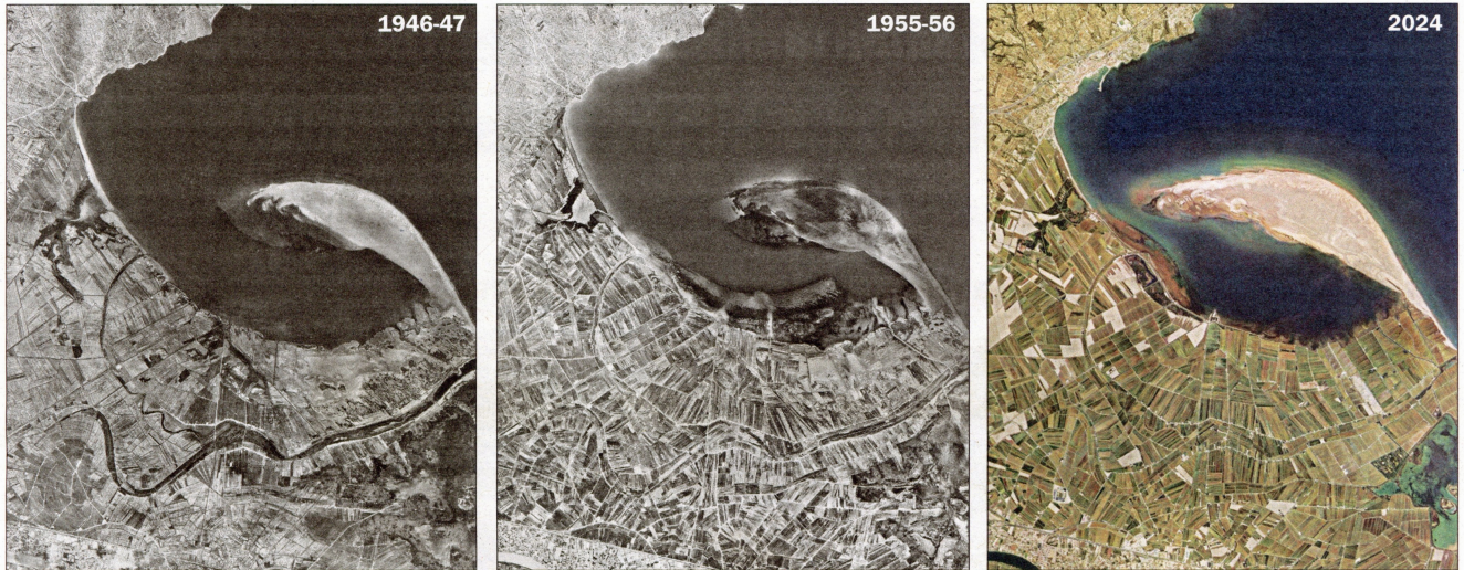
Tres imatges realitzades en vols aeris que constaten el progressiu tancament de la badia del Fangar, a l'extrem septentrional del delta de l'Ebre, des de la dècada dels anys 1950.