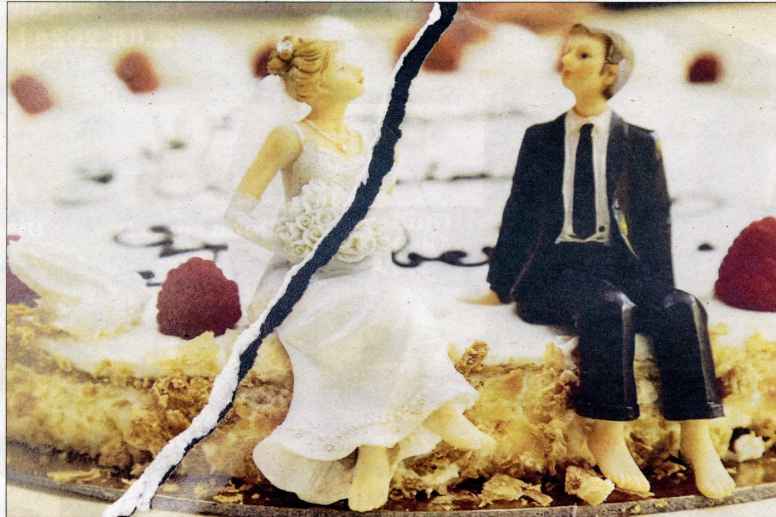
La taxa de divorcis per cada 100.000 habitants va ser de 188 a Terres de l'Ebre i el Priorat el 2023.

En el conjunt dels quatre partits judicials, el 64 % dels divorcis van ser consensuats, és a dir, ambdós cònjuges van estar d'acord en separar-se i en les condicions de com fer-ho. Este tipus de divorci és generalment més ràpid i menys costós que un divorci contenciós, on hi ha desacords entre les parts.