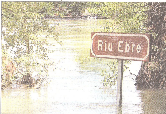
El pas de barca de Miravet va deixar d'oferir el seu servei de transport de viatgers i vehicles a causa de l'alt cabal del riu.