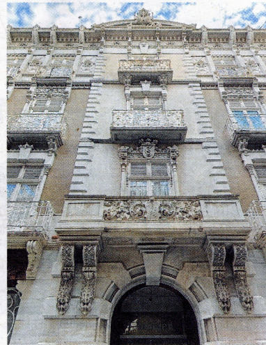
Casa Cervantes (1900, Cartagena).

Cansat d'aquesta situació de no poder desenvolupar més projectes, sumat a un canvi de govern que va arrossegar als principals tècnics de la ciutat, va decidir marxar. Primer, va estar uns anys d'arquitecte municipal a Gandia, on tenia més possibilitats de fer projectes, i d'allà va saltar a Cartagena, «on realment esclata el seu talent i té possibilitats de fer encàrrecs provinents de la burgesia enriquida per les mines de la zona». De la nit al dia, molts burgesos van enriquir-se i volien fer-se imponents cases. A Cartagena i voltants, Beltri va treballar amb intensitat i faria un miler d'encàrrecs. Allà va trobar l'entorn propici per al seu impuls creatiu.