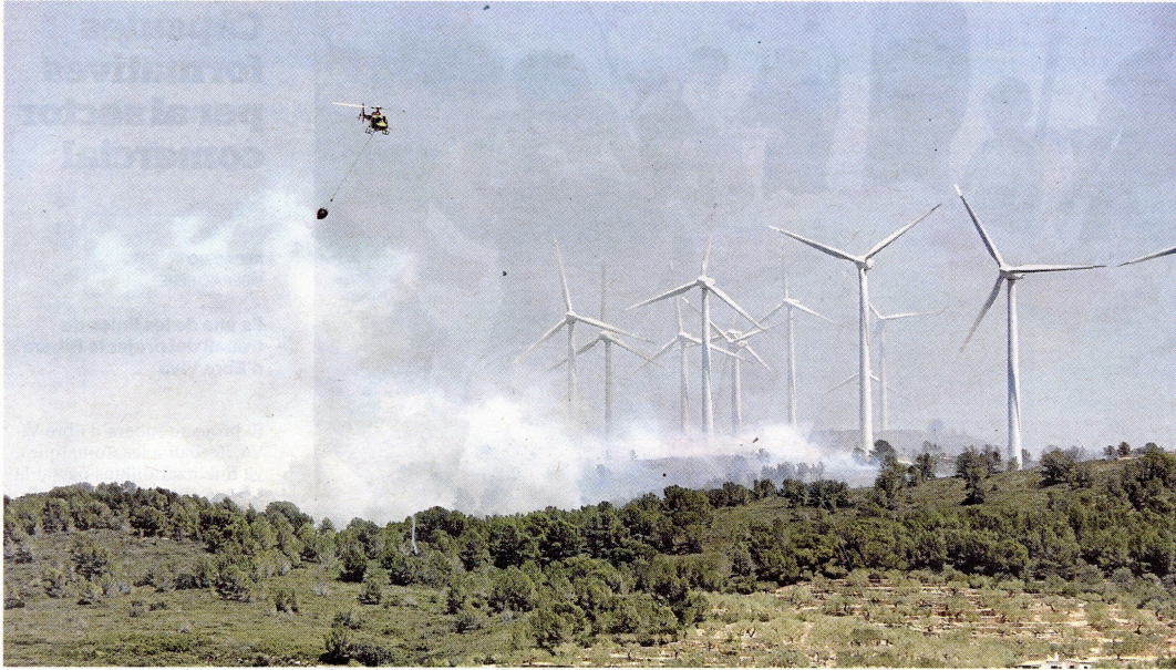
El recent incendi del Coll de l'Alba a Tortosa, on van cremar vora 90 hectàrees de terreny.

signades i «dotar el territori d'una capacitat de resposta que no es vegi alterada, durant el dia a dia, perquè hi hagi un servei extraordinari com un incendi forestal», «i que la població de les Terres de l'Ebre estigui igual de ben atesa que a qualsevol altre lloc».