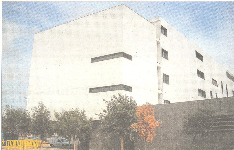
El nou edifici de l'institut de tecnificació esportiva.

Una de les principals novetats d'aquest curs serà la implantació de l'horari compactat. S'hi han adherit 14 de 17 instituts del territori, mentre que n'han quedat fora per pròpia voluntat els instituts de Tecnificació d'Ampostà i el de Santa Bàrbara, a més del de la Terra Alta, pel compli-