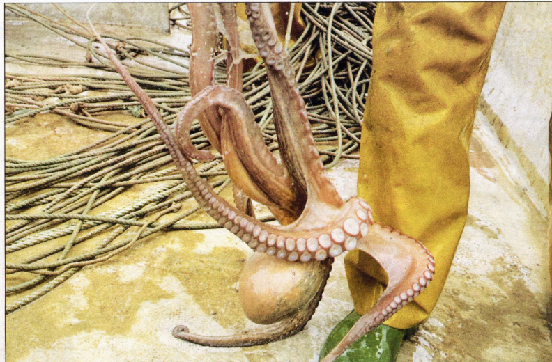
Els pescadors de la costa de l'Ebre van capturar el 2022 un total de 145 tones de pop roquer.

ÀMBIT TERRITORIAL El Pla de gestió del pop roquer de les Terres de l'Ebre capturat amb cadups i nanses, aprovat per la Generalitat de Catalunya el 7 de juliol de 2023, estableix l'àmbit territorial de de les confraries de pescadors de l'Ametlla de Mar, l'Ampolla, Deltebre, la Ràpita i les Cases d'Alcanar, el delimitat al sud per la demora de 133,3° traçada des de la desembocadura del riu Sénia i al nord per la