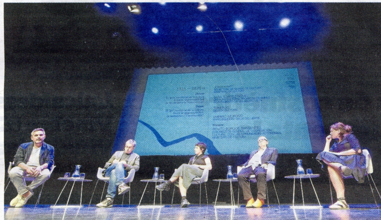
Una de les taules rodones ha reflexionat sobre el canvi d'escenari de la cultura cap al món rural.

Aquesta proliferació és genuïna però també ha tingut lloc en altres territoris eminentment rurals, com van reflexionar ahir els integrants d'una de les taules rodones. «La idea de futur, creativitat o de trencament era abans el territori urbà, la ciutat. A la ru-