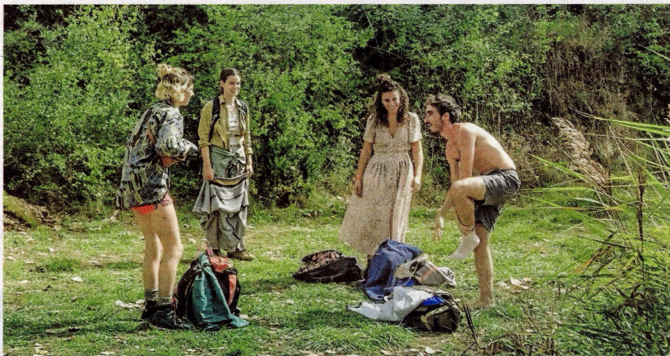
Imatge del film 'Els encantats'.