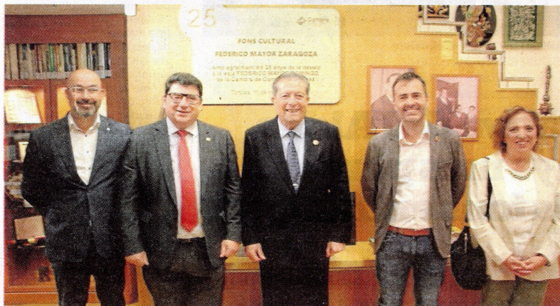
El propi Federico Mayor Zaragoza, al centre de la imatge, va poder visitar l'espai fa pocs dies.

És que Federico Mayor va fer nombrosos viatges arreu del món gràcies als quals va acabar col·leccionant un important nombre d'objectes. Més de 3.500 llibres d'art, història, ciència o literatura i 210 objectes artístics d'arreu de tot el món conformen el llegat de Federico Mayor Zaragoza que es pot visitar a la Cambra de Comerç de Tortosa, a la Casa Brunet. Desconegut per a molts