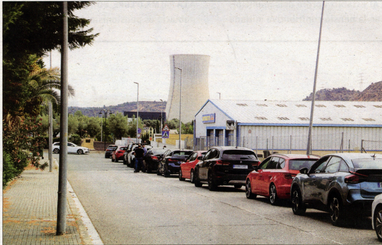
Els llocs de treball ben remunerats de la nuclear d'Ascó (a la fotografia), clau per entendre les dades de la Ribera.

D'acord amb l'última estadística de l'Idescat, a les Terres de l'Ebre hi ha cinc municipis on per cada tres habitants n'hi ha un que és pensionista. Es tracta de la Palma d'Ebre, la Fatarella, Bot, Paüls i Caseres. (Vegeu el quadre que publiquem per