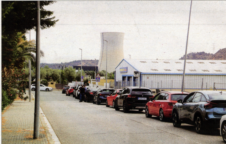
Als llocs de treball ben remunerats de la nuclear d'Ascó (a la fotografia), clau per entendre les dades de la Ribera.

D'acord amb l'última estadística de l'Idescat, a les Terres de l'Ebre hi ha cinc municipis on per cada tres habitants n'hi ha un que és pensionista. Es tracta de la Palma d'Ebre, la Fatarella, Bot, Paüls i Caseres. (Vegeu el quadre que publiquem per