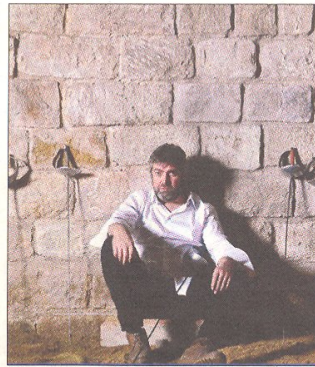
'Cyrano de Bergerac', 25 de gener a les 22 h.